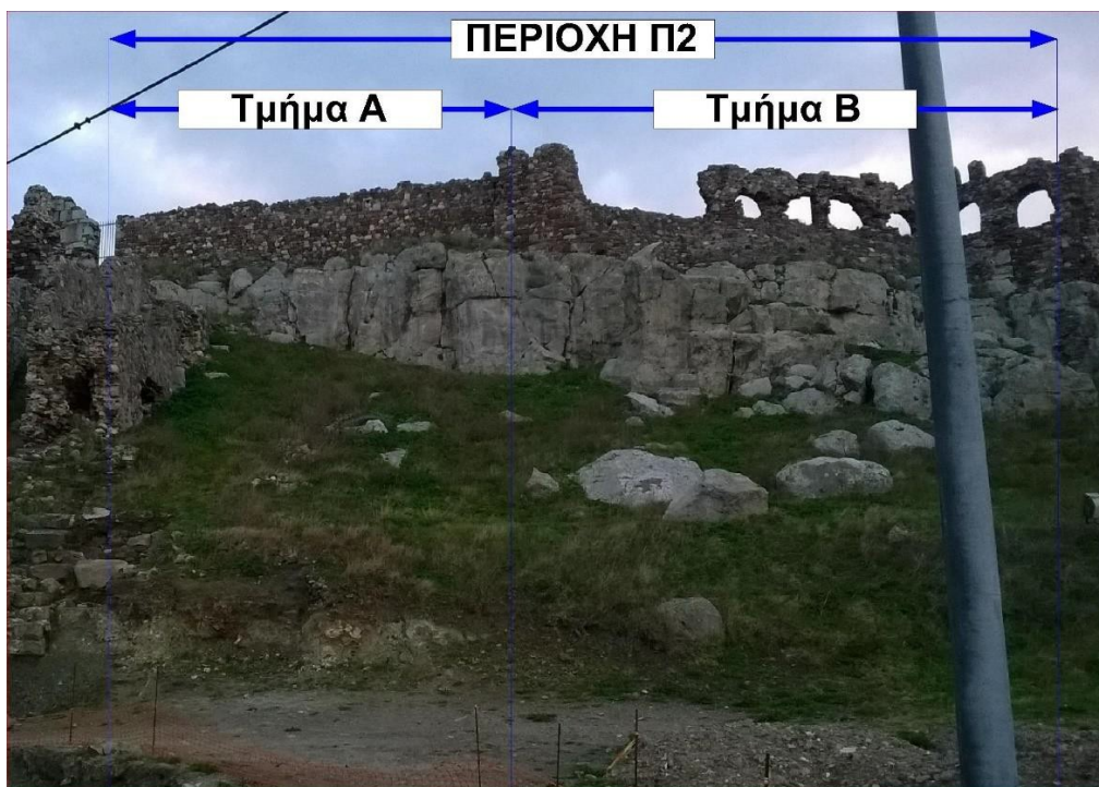
Εικόνα 1: Τμήματα Α και Β του Βορειοανατολικού τείχους

Το έργο θα πραγματοποιηθεί στα τμήματα Γ & Δ της Περιοχής Π1 και στα τμήματα Α & Β της Περιοχής Π2, όπως αυτό επισημαίνεται στα τεύχη και σχέδια. Μετά την υπογραφή της σύμβασης και πριν την έναρξη της υλοποίησης του έργου θα πραγματοποιηθεί επιτόπια οριοθέτηση της περιοχής εφαρμογής της μελέτης από τους επιβλέποντες του έργου πριν την έναρξη των εργασιών.